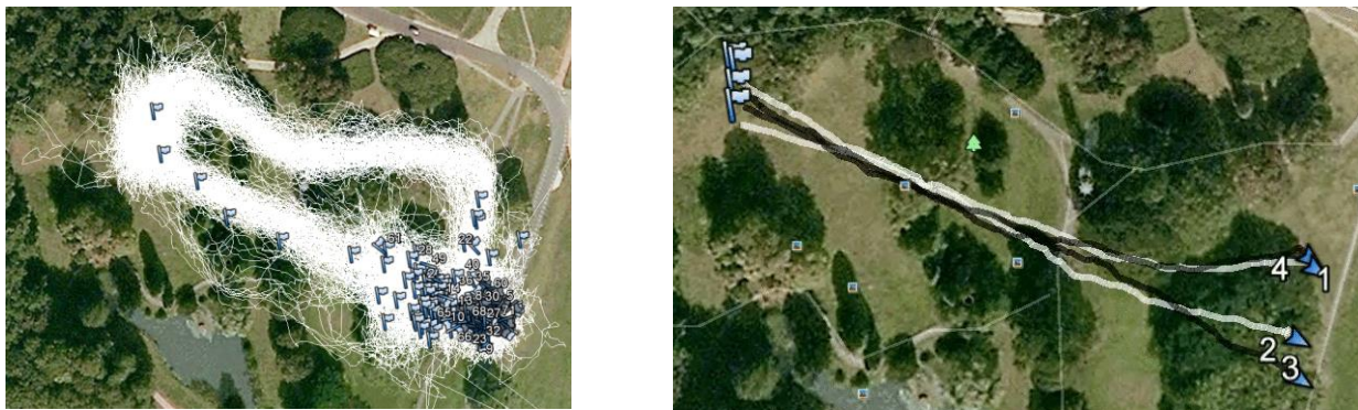
Figuur 2: De bewegingen van alle deelnemers gedurende de studie (links) en vier routes van een van de deelnemers (rechts)(Bron: Google Earth).